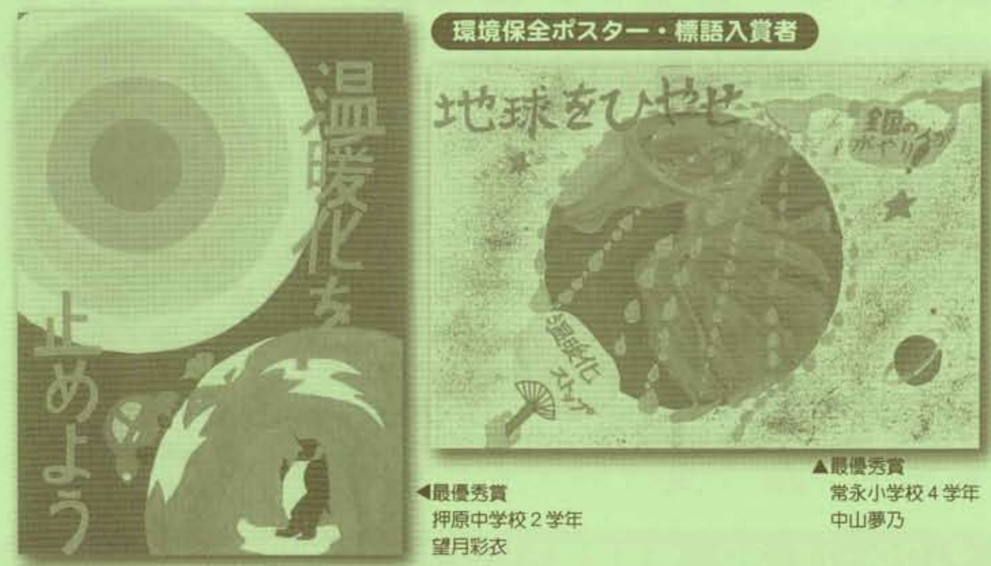
環境保全ポスター・標語入賞者